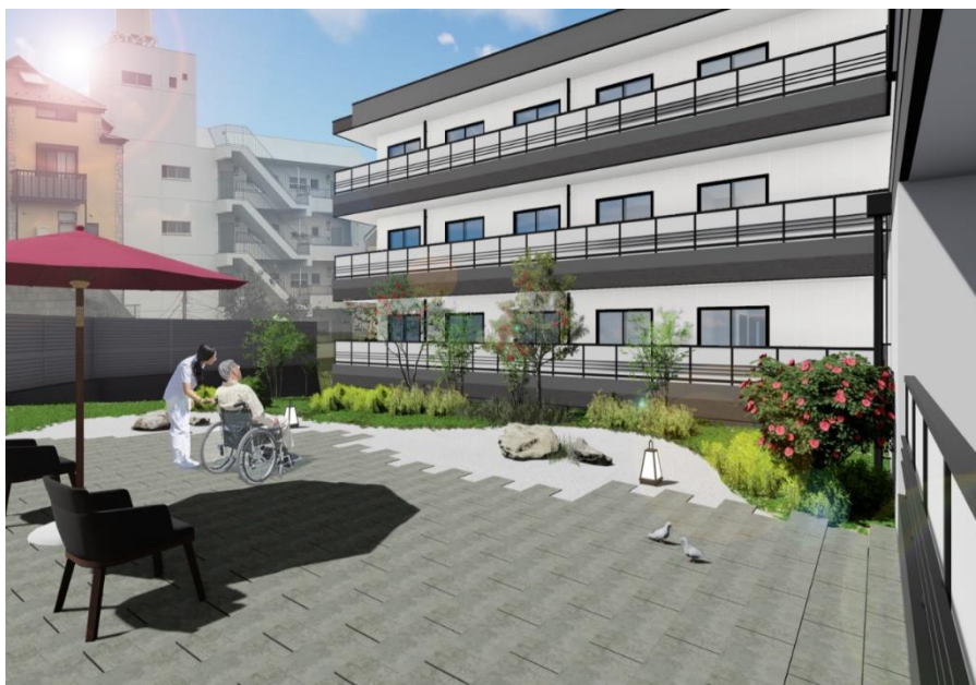
< ガーデンテラス (庭園) >