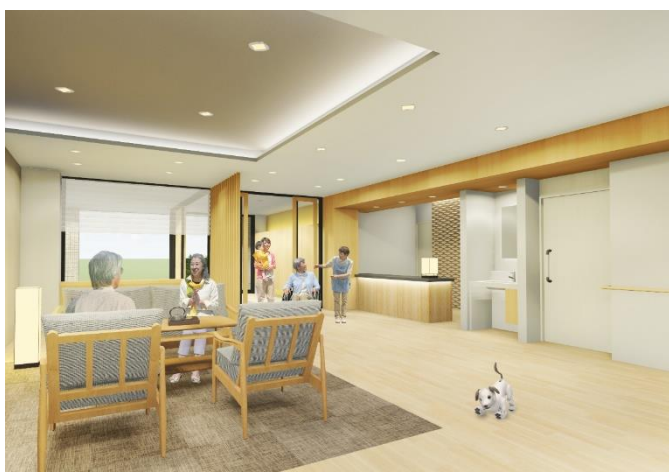
< 1F ラウンジ >