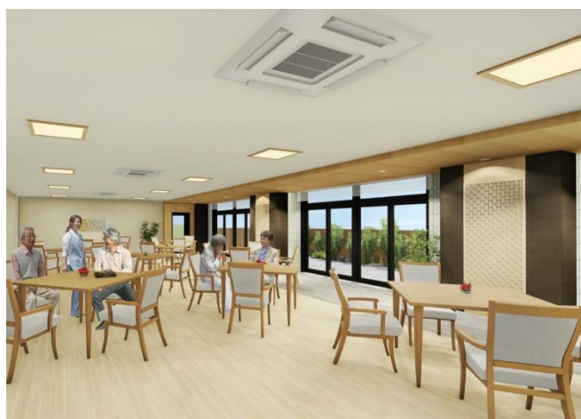
< 1F ダイニング (食堂) >