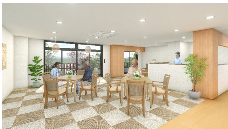
<リビング(談話スペース)>