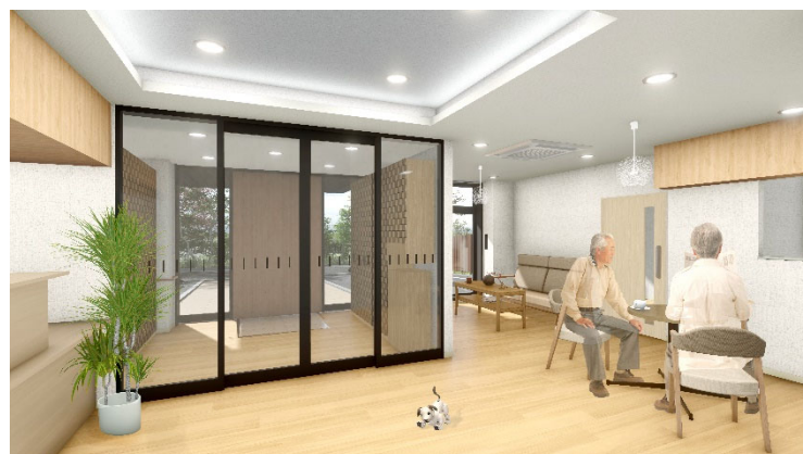
<エントランスラウンジ>