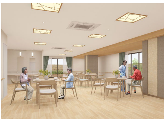
< ダイニング(食堂) >