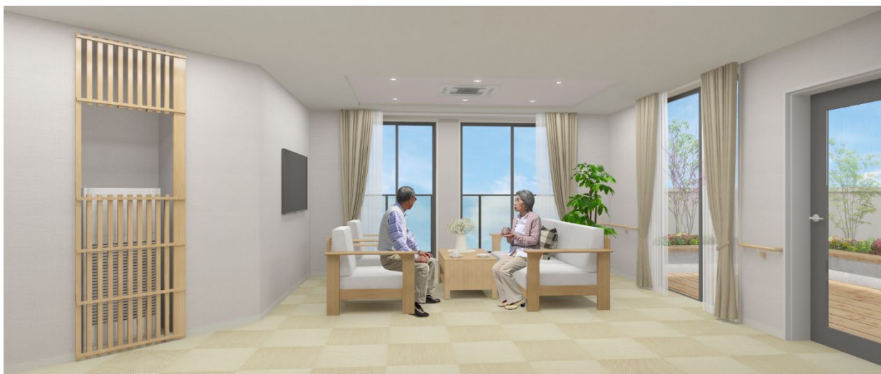
< リビング(談話スペース) >