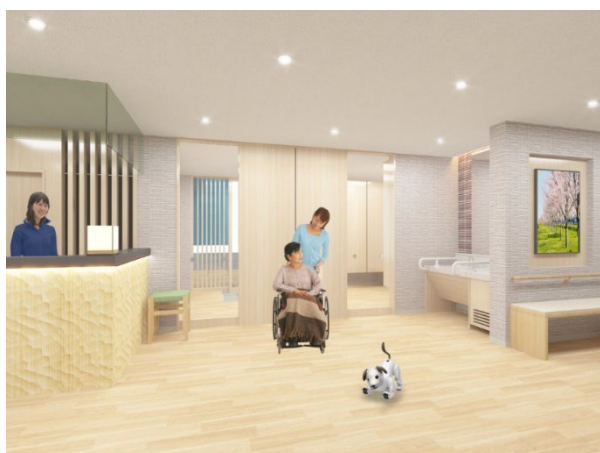
< エントランス >